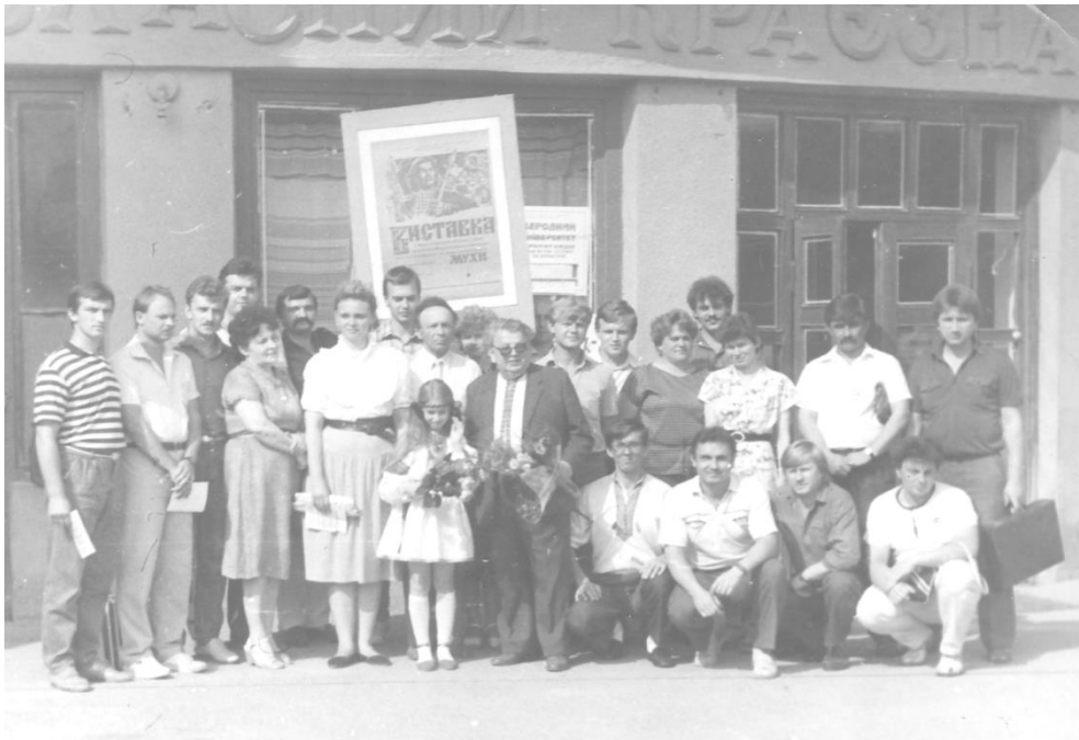
Учасники наукової конференції, присвяченої 500-річчю народного повстання селянина Мухи на Прикарпатті, біля краєзнавчого музею. м. Івано-Франківськ. 1990 р.