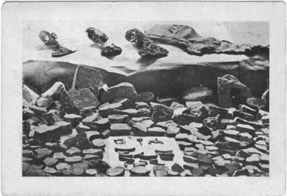
Археологічні знахідки, які виявив Я. Пастернак під час розкопок, 1937 р. Поштівки видавництва «Унія» (Львів)