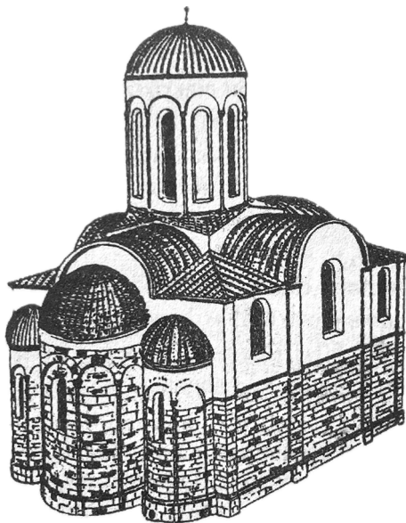
Реконструкція Й.Пеленським первісного вигляду церкви Св. Пантелеймона

Вивчаючи стіни костелу Св. Станіслава, Й. Пеленський звернув увагу, що до давнього часу має стосунок лише нижня частина споруди. На межі