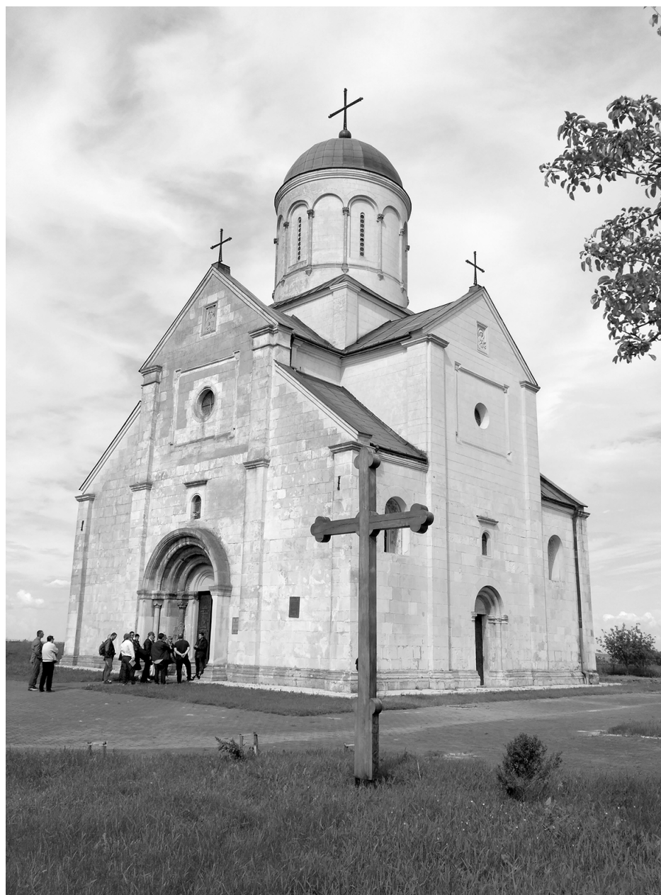
Храм Св. Пантелеймона в селі Шевченкове. Сучасний вигляд. 2017 р.