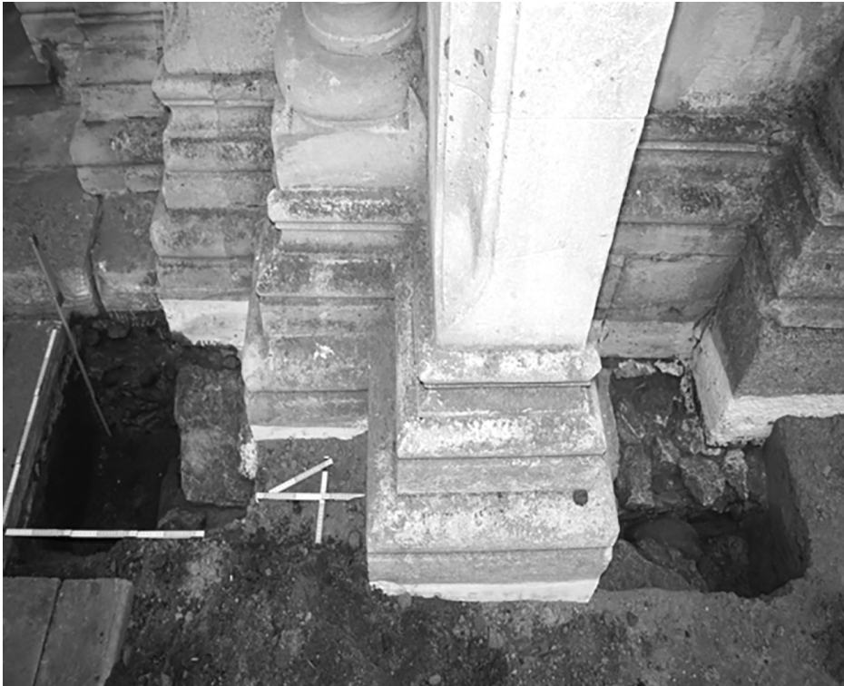
Дослідження фундаменту храму Св. Пантелеймона.