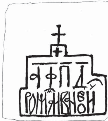
Мал. 3. Пам'ятна плита Романа Івановича (фотографія і промалювання)