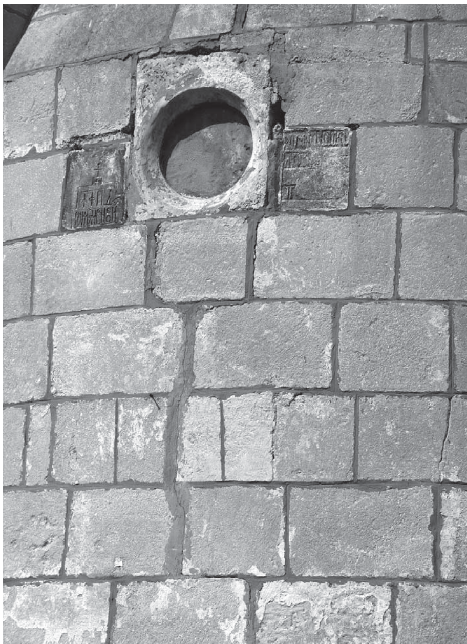
Мал. 5. Пам'ятні плити 1584 та 1579 рр. у муруванні апсиди