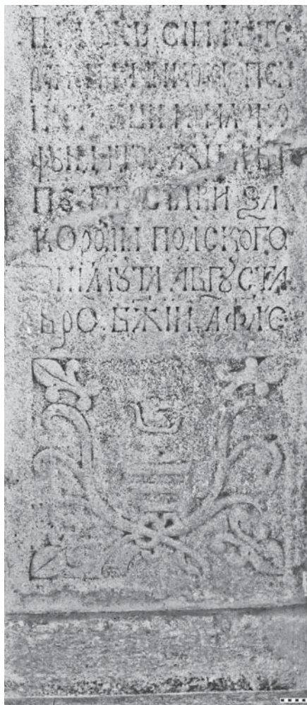
Мал. 1. Фотографія надгробка Марка Шумлянського