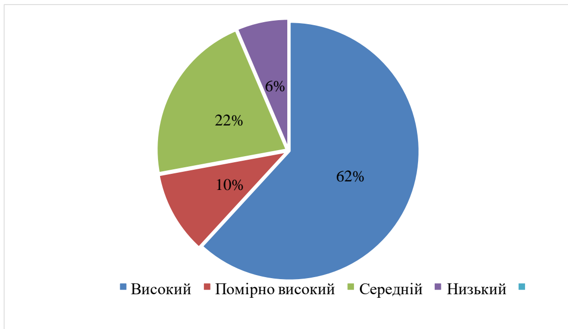
Рис. 2. Рівень мотивації до успіху в дітей 8–10 років, які займаються грепплінгом

Формування мотивації до занять спортом, зокрема грепплінгом, на початковому етапі підготовки, це насамперед постійна робота тренерів. Щоб зацікавити дітей, їм варто формувати в юних спортсменів мотивацію успіху, зацікавлювати до занять іграми, змінювати засоби й методичні прийоми, форми проведення тренувальних занять; робити помилки потрібним і нормальним явищем; показувати цінність помилок; мінімізувати негативні наслідки від помилок; формувати віру в успіх; розкривати сильні сторони спортсменів; демонструвати особисту віру в спортсменів; повторювати і закріплювати успіх; визнавати досягнення, щоб діти відчували особистий прогрес; спонукати до “самовизнання”, участі в змаганнях, порівнювати свій прогрес, обговорювати його з іншими дітьми в секції, щоб вони допомагали один одному.