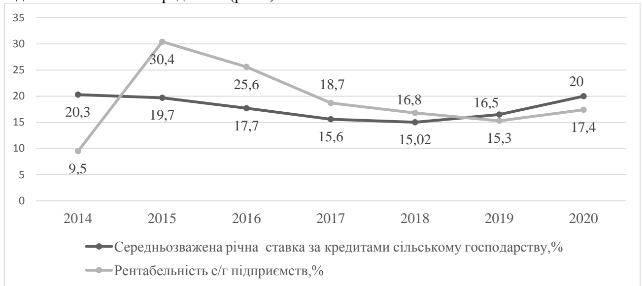
Рис. 2. Динаміка вартості банківських фінансових інструментів та рентабельності сільськогосподарських підприємств у 2014–2020 роках [6, 8, 9, 10]

Поряд із динамікою обсягів кредитування аграрного сектора доцільним буде розглянути тенденції змін рівня рентабельності сільськогосподарських підприємств та відсоткових ставок за кредитами (рис.2).