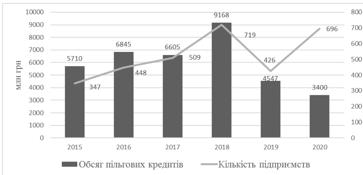
Рис. 3. Динаміка залучення пільгових кредитів суб'єктами господарювання АПК України [11, 12, 13]