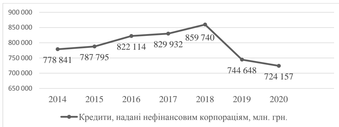
Рис. 1. Динаміка обсягів банківських кредитів, наданих нефінансовим корпораціям [6]

Якщо проаналізувати динаміку обсягів наданих банківських кредитів нефінансовим корпораціям, то за період з 2014 до 2018 року простежується тенденція збільшення обсягів кредитування. Але в 2019 – 2020 роках має місце незначне зниження обсягів наданих кредитів, яке пов'язане з політичною ситуацією в країні (рис. 1).