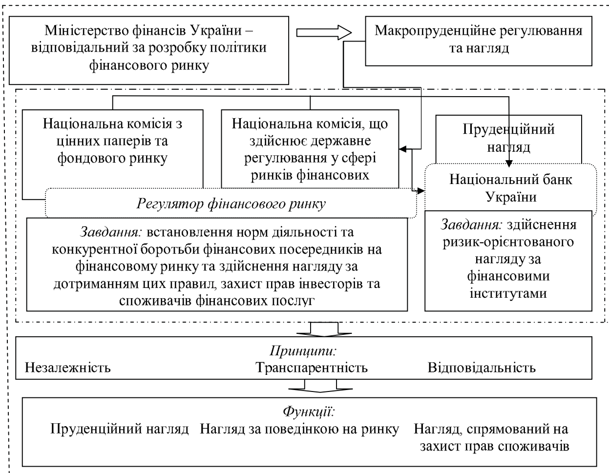
Рис. 2. Інфраструктура регулювання та нагляду за фінансовими посередниками на основі моделі «двох вершин» (складено автором)

II етап – визначення чинників, що формують необхідні вимоги до макрорегулювання діяльності банків: макроекономічні умови розвитку банківського сектору економіки; зовнішньоекономічні фактори; соціально-економічна політика держави; структурні зміни у фінансовій сфері; особливості бюджетної і податкової політики; інформаційна прозорість бізнес-процесів банку; рівень розвитку та ступінь лібералізації банківської системи, її залучення у процеси глобалізації;