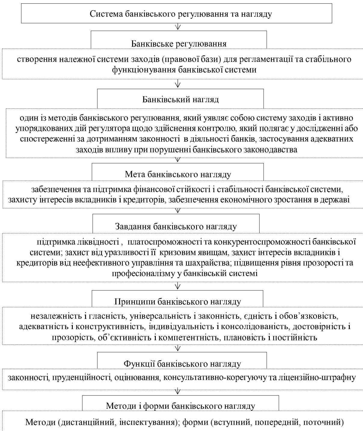
Рис. 1. Структурно-логічна схема теоретичного обґрунтування економічної сутності банківського регулювання та нагляду [11, С. 368]

Проблематикою удосконалення системи регулювання банків України на сьогодні є в першу чергу упорядкування інфраструктури фінансового ринку, що викликано не виконанням фінансовими посередниками функції фінансового забезпечення сталого економічного розвитку, недостатньою незалежністю органів регулювання та нагляду, відсутністю інформаційної прозорості, відсутністю стійкого розвитку.